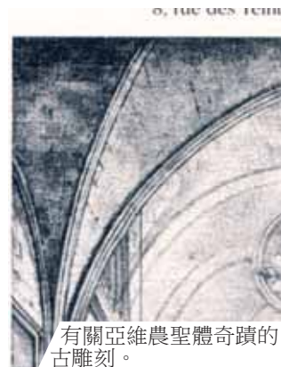
有關亞維農聖體奇蹟的古雕刻。