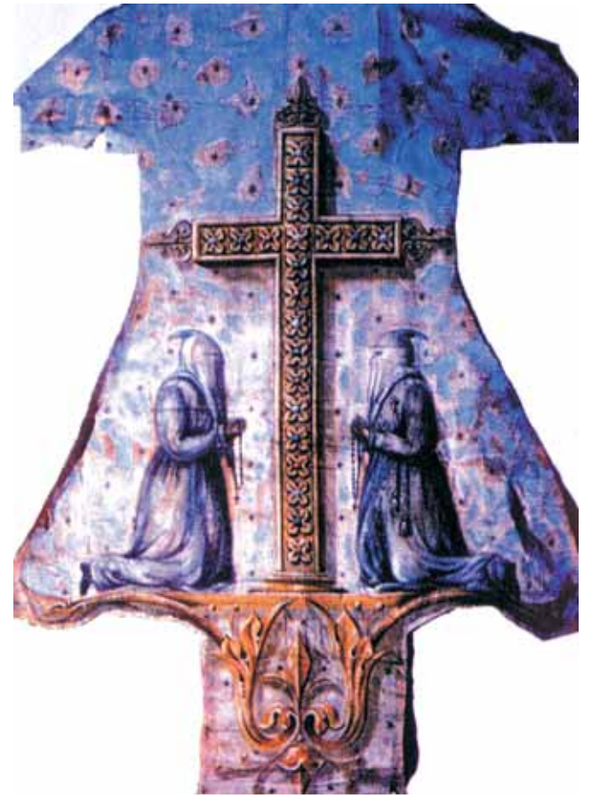
灰衣苦修會的長袍。