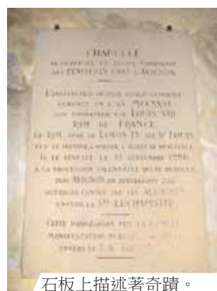
石板上描述著奇蹟。