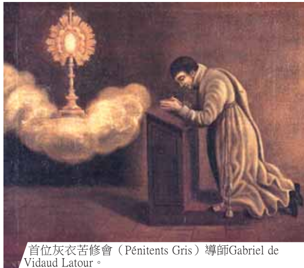
首位灰衣苦修會 (Pénitents Gris) 導師Gabriel de Vidaud Latour。