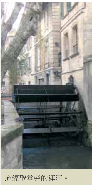
流經聖堂旁的運河。