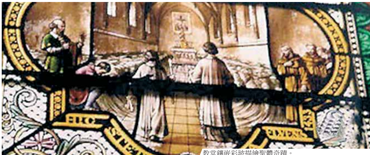
教堂鑲嵌彩玻描繪聖體奇蹟。

1433年11月30日，灰衣苦修小兄弟會（Confraternité des « Pénitents Gris »）小聖堂裡擺上聖體光，供人朝拜聖體。突然，羅納河水暴漲，淹沒了亞維農。兩名灰衣苦修會弟兄乘了一艘小船前來，護守聖體不受破壞。待他們進入聖堂時，看到水自動分為兩邊，一左一右，祭台和聖體光都是乾的。