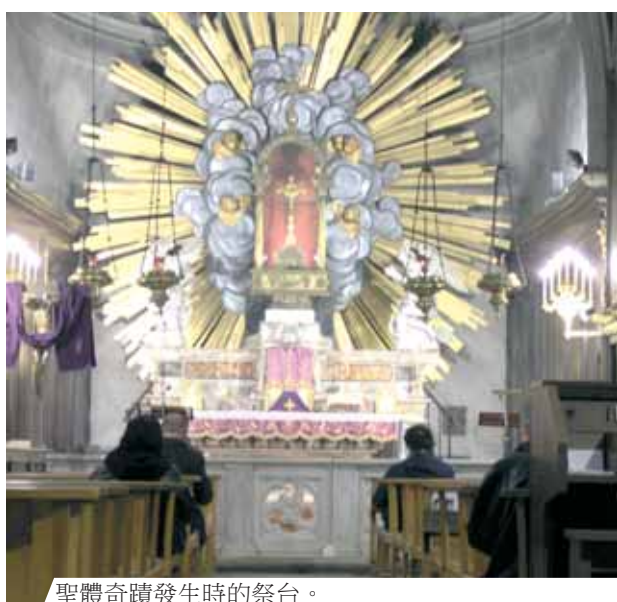
聖體奇蹟發生時的祭台。