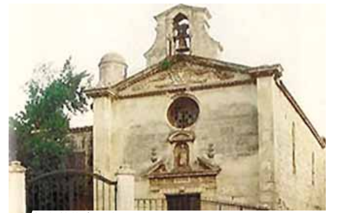
灰衣苦修會聖堂正面。