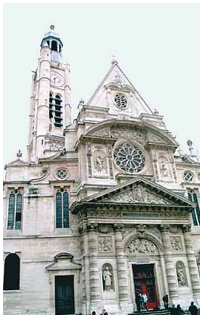
山上的聖斯德望堂 (Saint-Étienne-du-Mont)。