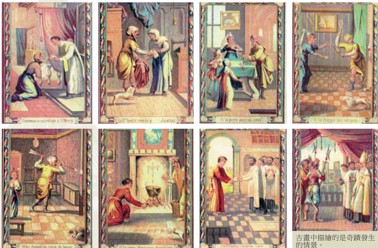
古畫中描繪的是奇蹟發生的情景。