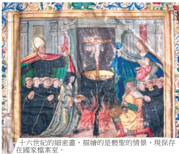
十六世紀的細密畫，描繪的是褻聖的情景，現保存在國家檔案室。