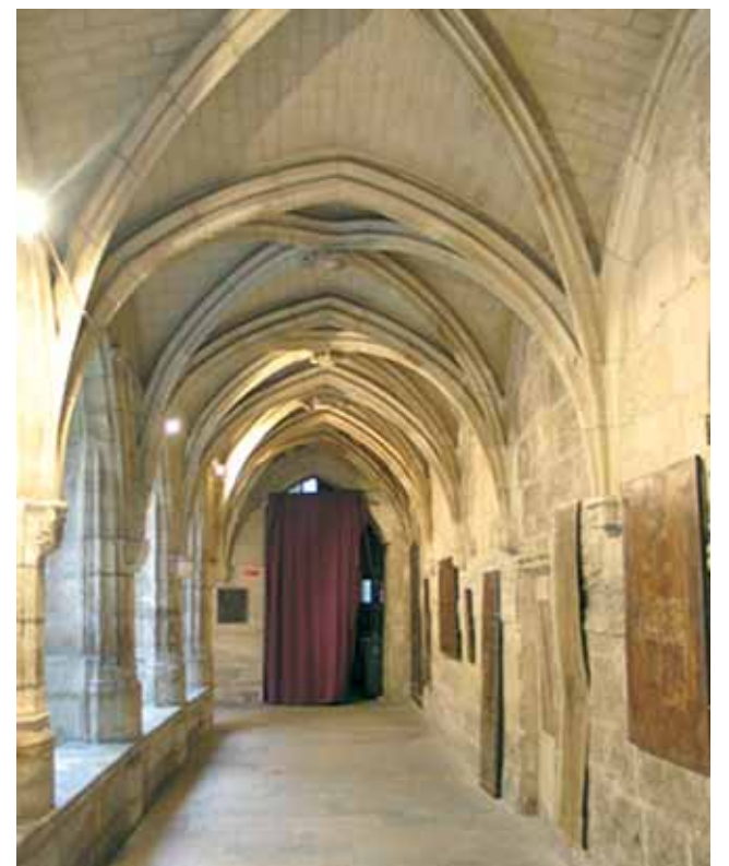
柴火堂內院。現已成為基督新教的禮拜堂。