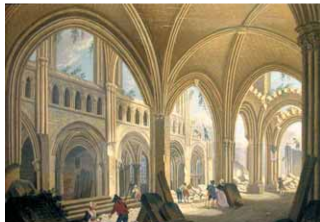
拆除「沙灘廣場上的聖若望堂」，由Pierre-Antoine Demachy於1797年所畫。