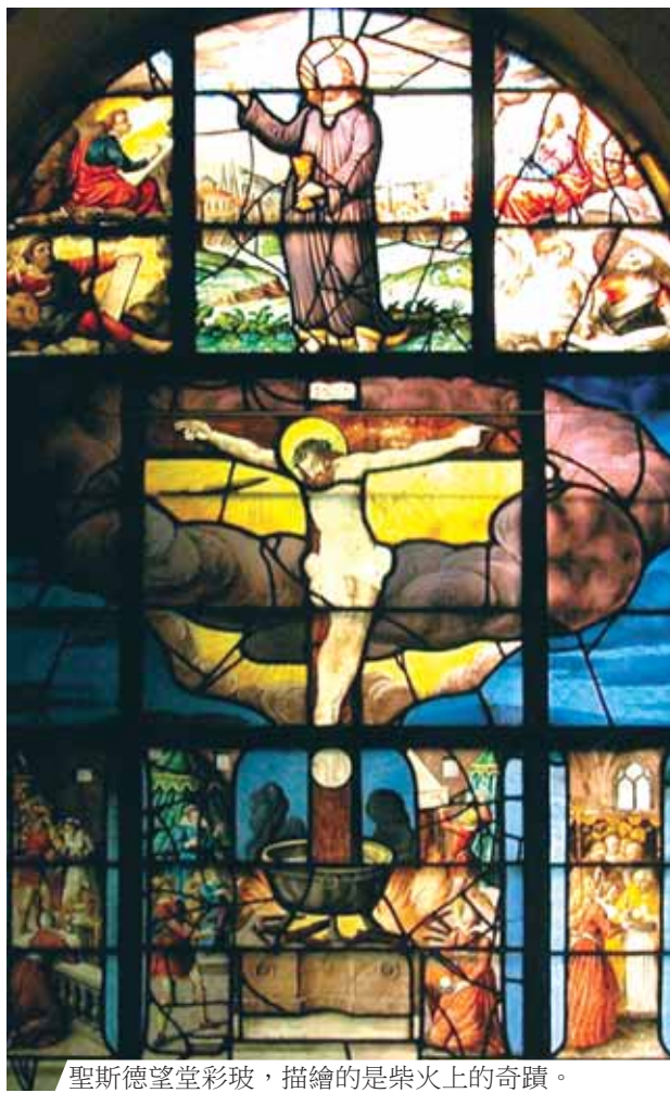
聖斯德望堂彩玻，描繪的是柴火上的奇蹟。

1290年復活節時，一位憎恨天主教信仰，也不相信基督親臨聖體聖事的非教友，拿到了一塊聖體，準備加以褻瀆。他將聖體刺開，投入滾水中。沒想到聖體在這名男子面前由水中跳出，懸空，最後出現在一位虔誠婦女的碗裡。婦女立刻將聖體拿給本堂神父。教會當局、民眾，和國王都決定將褻瀆者的房子改建為聖堂，以保存奇蹟聖體。但這間聖堂在法國大革命時被摧毀。