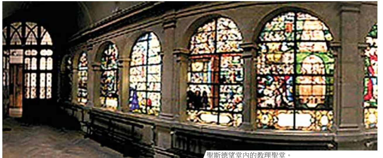
聖斯德望堂內的教理聖堂。