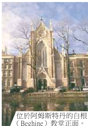
位於阿姆斯特丹的白根 (Beghine) 教堂正面。

1452時， 聖堂因受 祝融之災 而摧毀， 不可思議 的是裝著 聖體的聖 體光完好 如初。