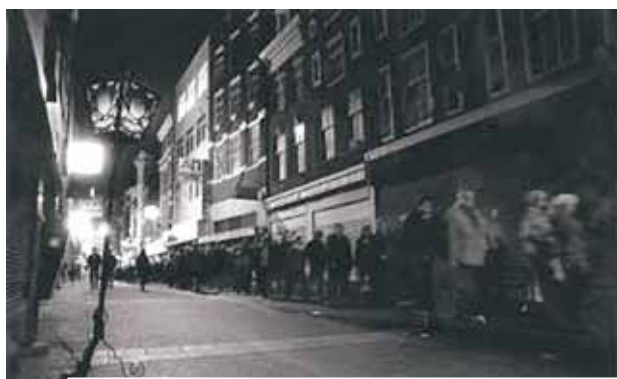
每年都舉行的靜默遊行 (Stille Omgang)，為了紀念聖體奇蹟。