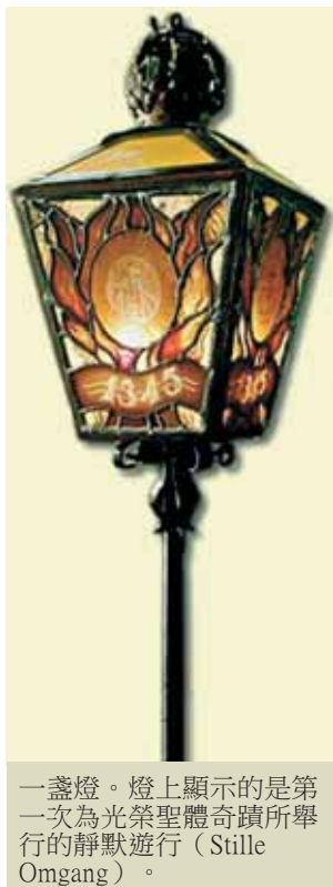
一盞燈。燈上顯示的是第一次為光榮聖體奇蹟所舉行的靜默遊行 (Stille Omgang)。