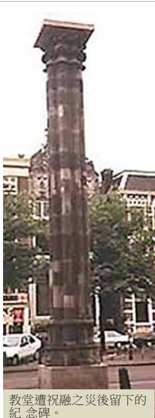
教堂遭祝融之災後留下的紀念碑。