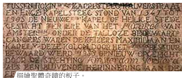
描繪聖體奇蹟的板子。