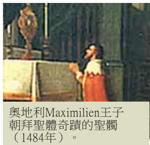
奧地利Maximilien王子朝拜聖體奇蹟的聖體 (1484年)。