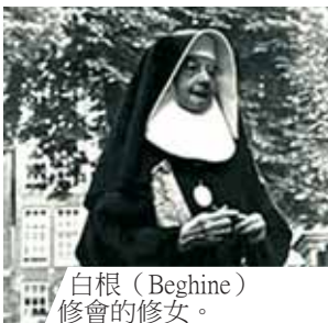
白根 (Beghine) 修會的修女。