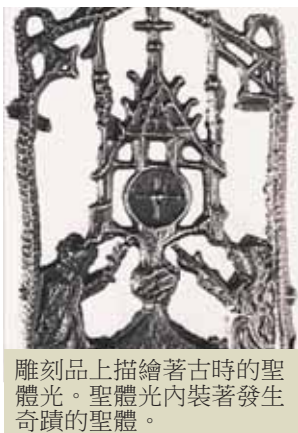
雕刻品上描繪著古時的聖體光。聖體光內裝著發生奇蹟的聖體。