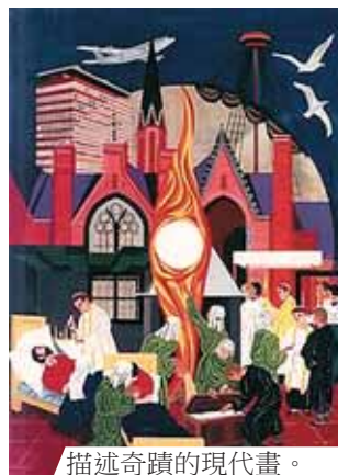
描述奇蹟的現代畫。