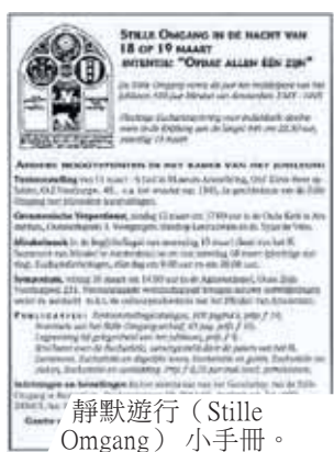
靜默遊行 (Stille Omgang) 小手冊。