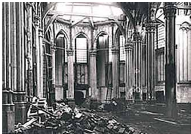
1908年，教堂的小聖堂再次遭受破壞。