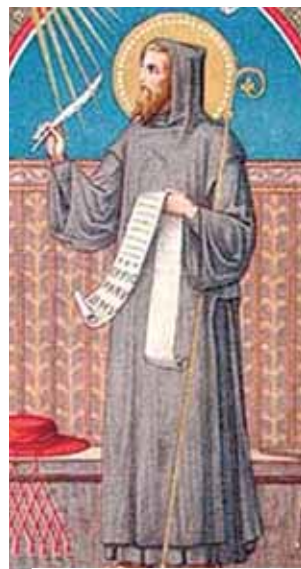
教宗聖額我略的聖像