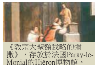
《教宗大聖額我略的彌撒》，存放於法國Paray-le-Monial的Hiéron博物館。