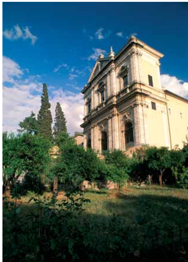
位於羅馬Celio的聖額我略堂。