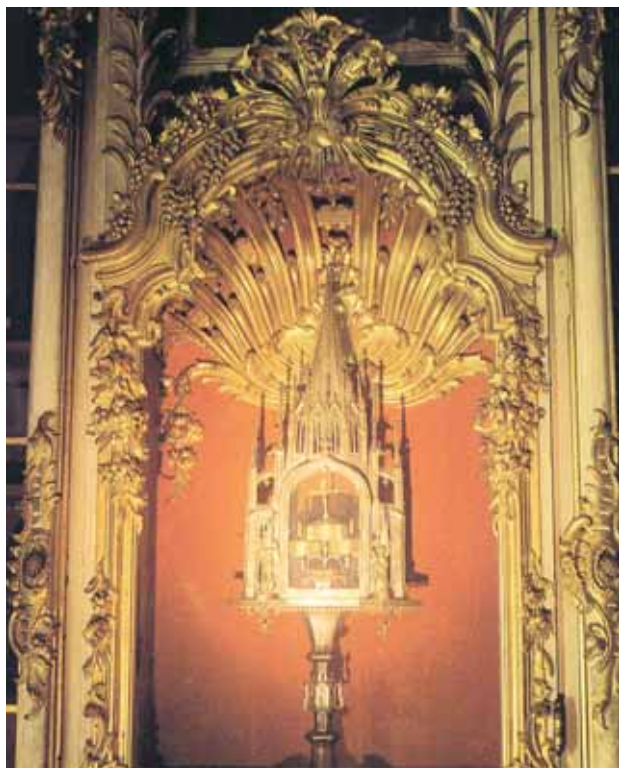
聖物盒中放著發生奇蹟的聖體。如今聖體依舊保存在Andechs中。

這個發生奇蹟的聖體現在保存在德國Andechs的聖本篤修道院中。聖蹟於595年發生在羅馬，當時教宗大聖額我略正在舉行聖祭。正當領聖體時，一位羅馬貴婦笑了出來，懷疑基督真實臨在祝聖的餅酒中。教宗非常不悅這位貴婦的舉動，決定不將聖體給她，此時麵餅立刻變為體血。