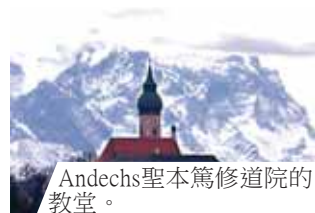
Andechs聖本篤修道院的教堂。