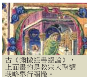
古《彌撒經書總論》，上面畫的是教宗大聖額我略舉行彌撒。