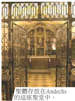
聖體存放在Andechs的這座聖堂中。