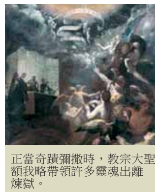
正當奇蹟彌撒時，教宗大聖額我略帶領許多靈魂出離煉獄。