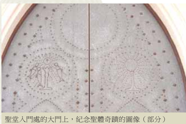
聖堂入門處的大門上，紀念聖體奇蹟的圖像（部分）