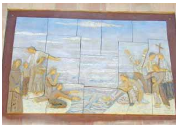
聖堂外側鑲嵌壁畫。