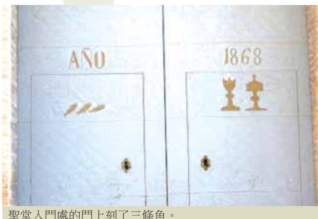
聖堂入門處的門上刻了三條魚。