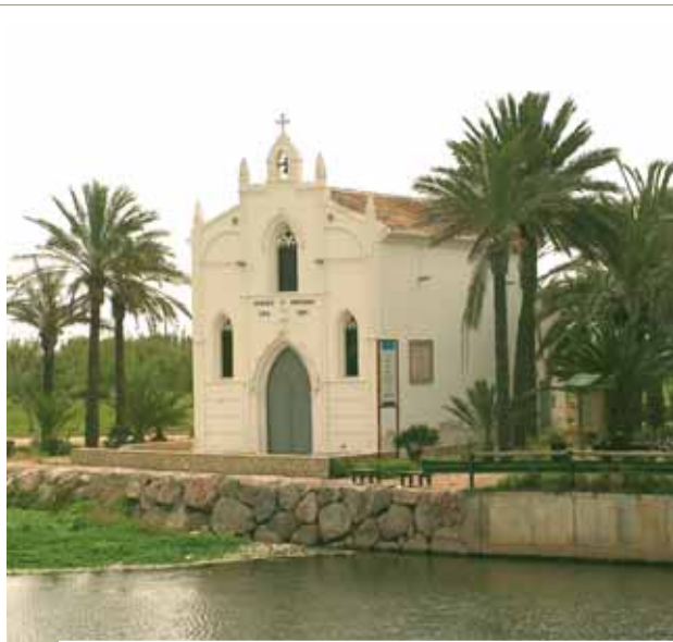
阿伯拉亞的隱修小聖堂。