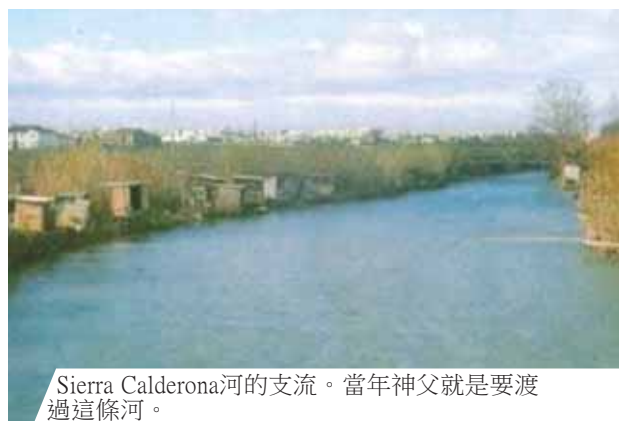
Sierra Calderona河的支流。當年神父就是要渡過這條河。