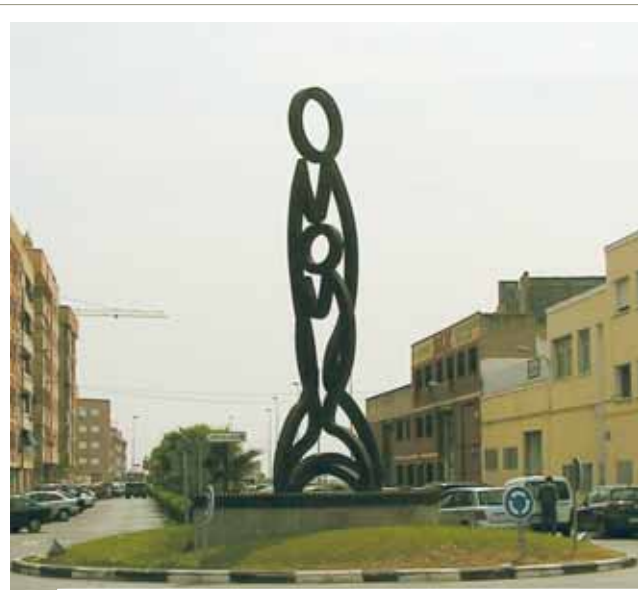
城中的雕像，紀念聖體奇蹟。