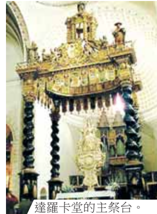
達羅卡堂的主祭台。