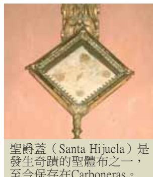
聖爵蓋 (Santa Hijuela) 是發生奇蹟的聖體布之一，至今保存在Carboneras。