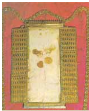
兩塊沾了聖血的九摺布，其中一塊保存在達羅卡教堂裡。

這次的聖體奇蹟正好發生在西班牙與摩爾人的多次戰役之前。幾位基督信仰的指揮官要求營裡的神父舉行彌撒聖祭，然在祝聖幾分鐘之後，敵方突然發動攻擊，迫使神父中斷彌撒，並將祝聖的聖體藏在舉行聖祭的布裡。西班牙人群起進攻，打了勝仗。回來後，指揮官要求神父分送之前祝聖的聖體。當神父找出聖體時，卻發現聖體浸透了血。直到今日，人們還可以前去瞻仰這塊沾染血跡的布。