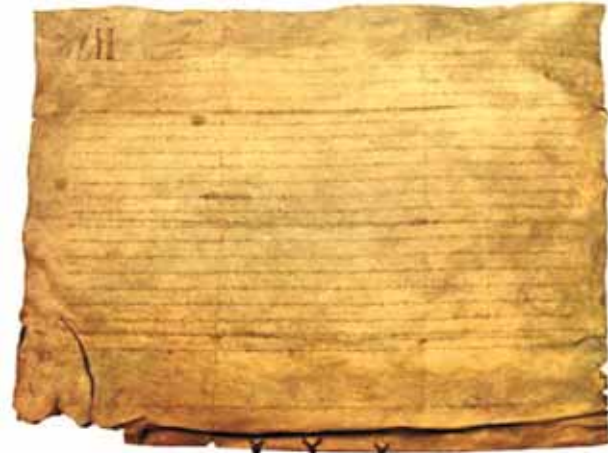
寫在羊皮卷上的《Chiva之信》(Carta de Chiva)，上面記載著聖體奇蹟。目前保存在協同教會 (collegiate church) 中。