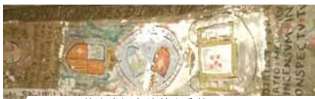
Carboneras的聖堂裡存放著聖爵蓋。