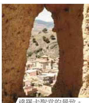
達羅卡聖堂的景致。