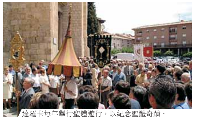
達羅卡每年舉行聖體遊行，以紀念聖體奇蹟。