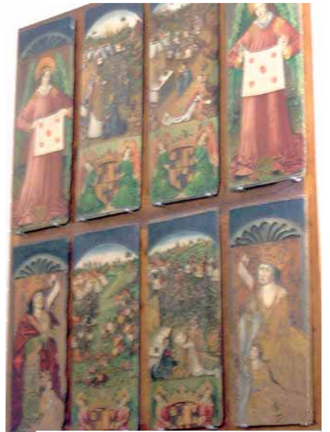
九摺布聖堂的壁畫描繪著聖體奇蹟。