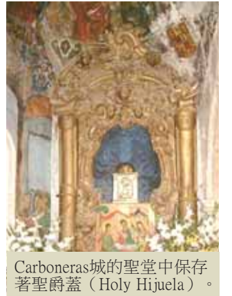
Carboneras城的聖堂中保存著聖爵蓋 (Holy Hijuela)。