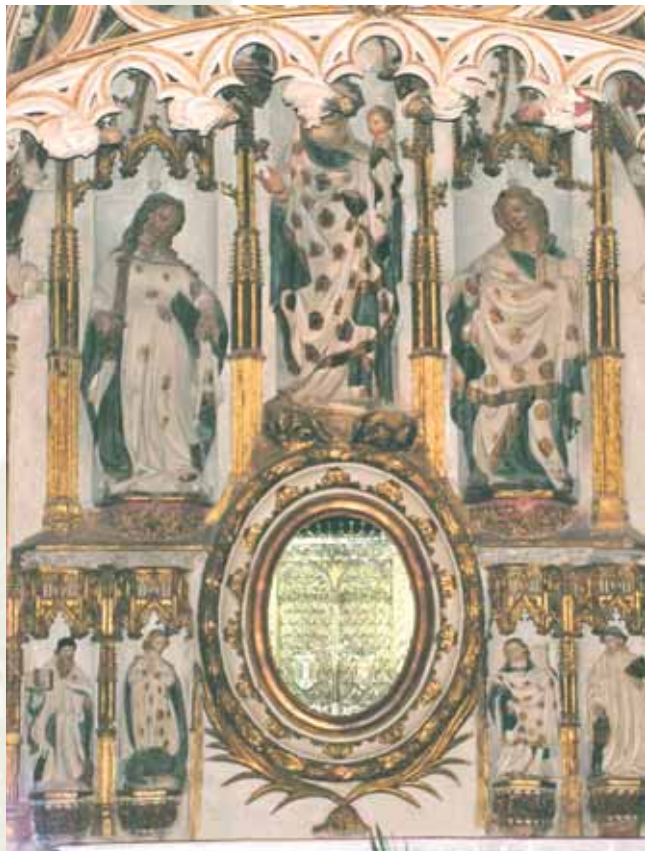
存放九摺布的小聖堂。