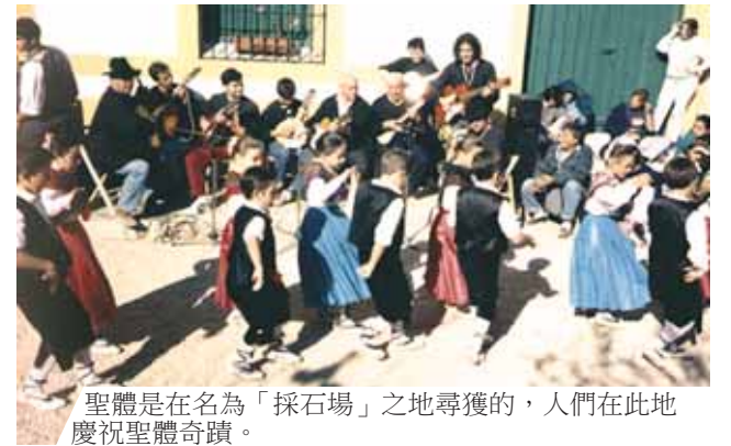
聖體是在名為「採石場」之地尋獲的，人們在此地慶祝聖體奇蹟。