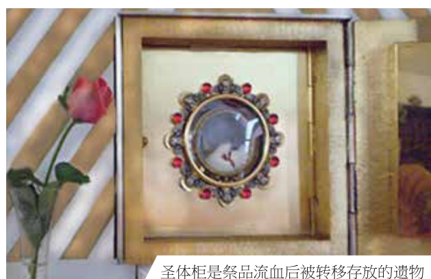
圣体柜是祭品流血后被转移存放的遗物