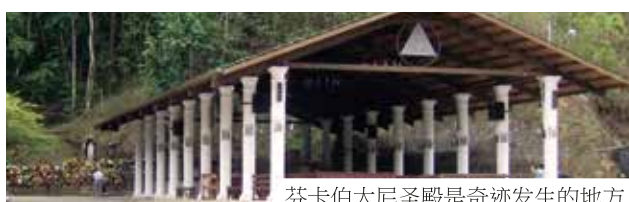
芬卡伯大尼圣殿是奇迹发生的地方