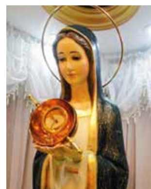
在洛斯特克斯耶稣圣心聚集的修道院教堂里的新的圣体柜，被转移到了伯大尼圣体奇迹博物馆。