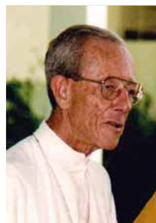
皮奥主教贝洛里卡多证实了伯大尼的奇迹